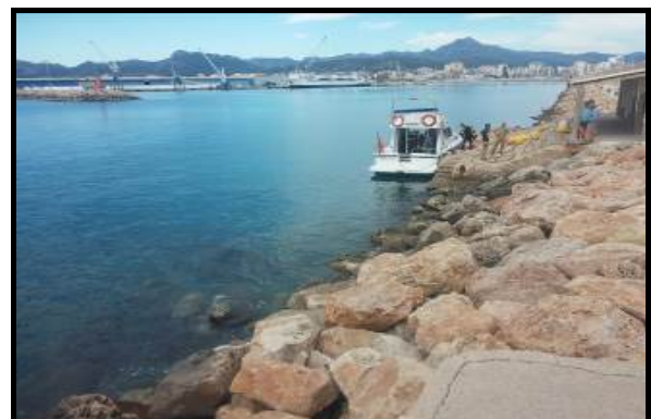
Tendido de la fibra submarina