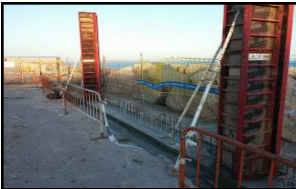
Ejecución de cimentación del muro