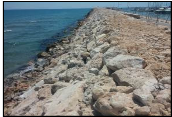
Estado final de la recolocación en talud de escollera