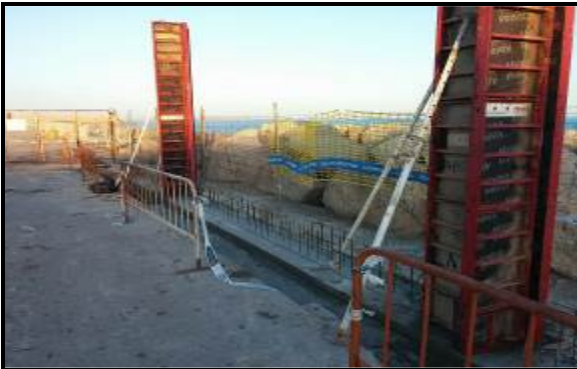
Ejecución de cimentación del muro