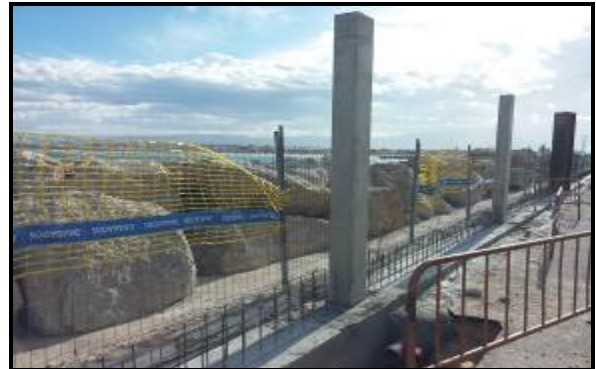
Ejecución de pilares y muro de cerramiento