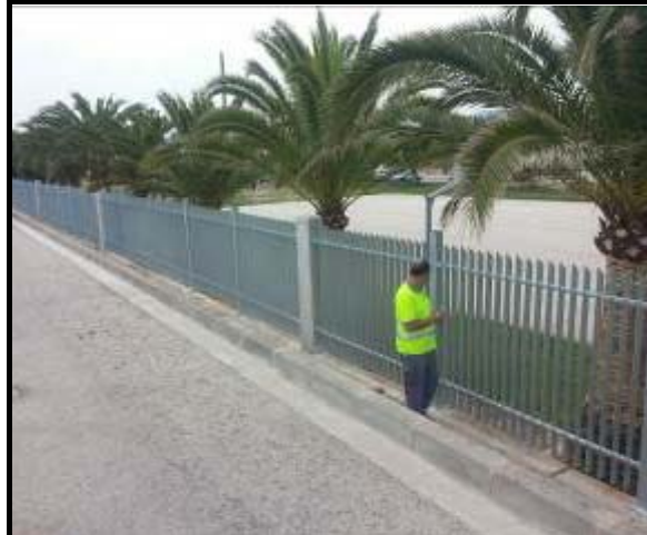
Final de las Obras