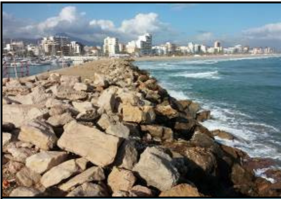
Estado inicial antes de la recolocación en talud