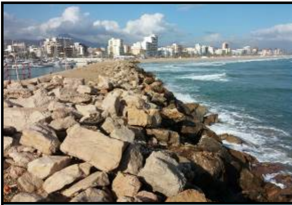
Estado inicial antes de la recolocación en talud