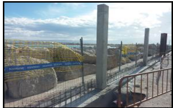
Ejecución de pilares y muro de cerramiento