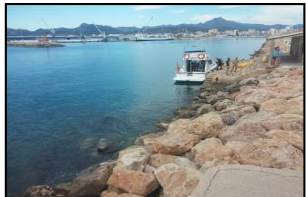
Tendido de la fibra submarina