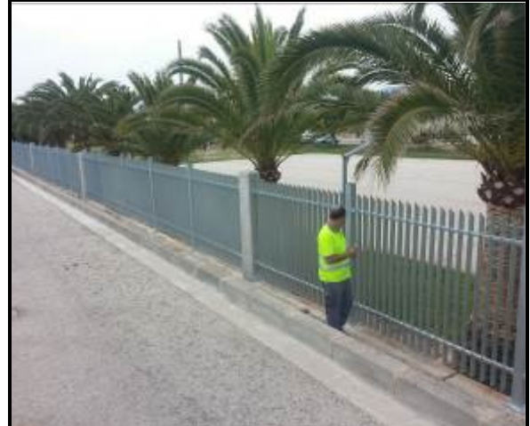
Final de las Obras