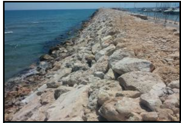
Estado final de la recolocación en talud de escollera