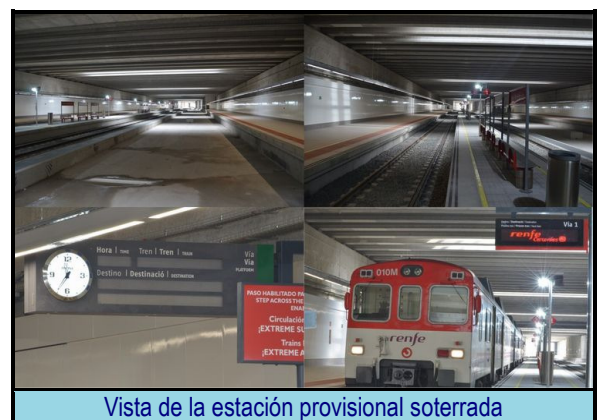
Vista de la estación provisional soterrada