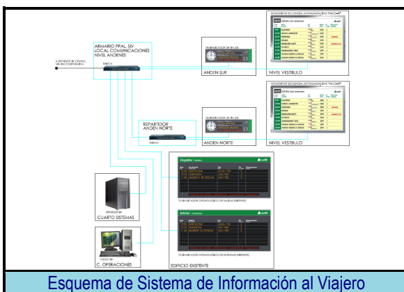
Esquema de Sistema de Información al Viajero