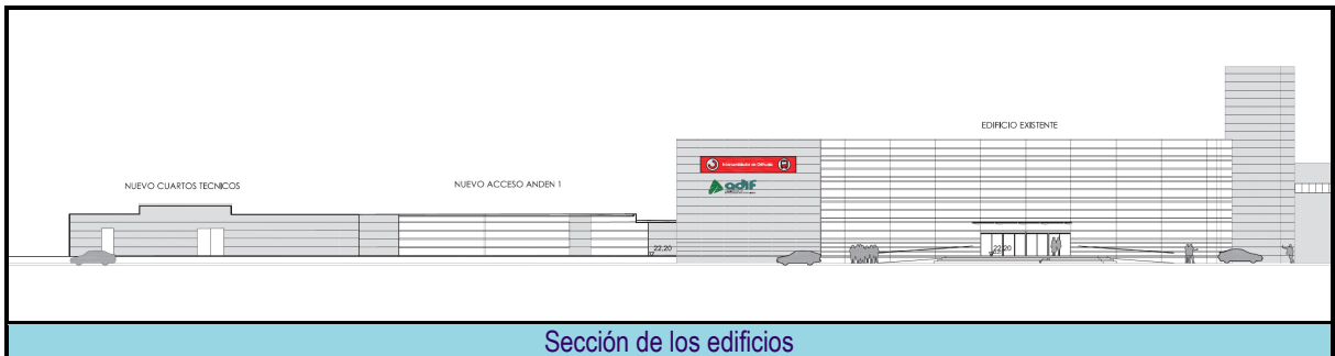
Sección de los edificios